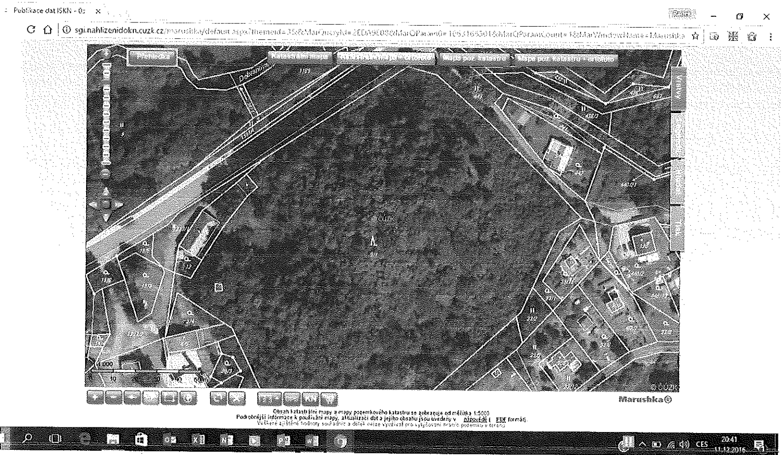
Obr.3 - Vytvoření naučné stezky na Pihelský vrch